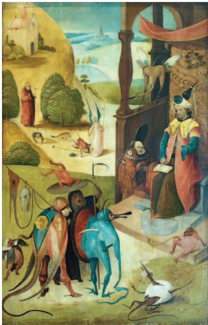
Fig. 3 Scuola di Hieronymus Bosch: San Giacomo e il Mago Ermogene.

mogene in primo piano, seduto su di un trono di fronte a una comitiva di creature diaboliche. Ha nelle mani un libro di magia e segna con l'indice della mano destra la formula evocatoria. In lontananza, San Giacomo si avvicina preceduto da un angelo: di fronte alla croce le creazioni demoniche sono costrette a prostrarsi e l'incantesimo sembra svanire. Ma l'attenzione è centrata su Ermogene e sulla sua prassi ermetica: sul capo indossa una sorta di turbante sormontato da un alambicco, sul davanti ha una placca cosparsa di stelle. L'alambicco è l' ambix alchemico: nel I sec. d.C. Plinio e Dioscoride avevano descritto l'estrazione del mercurio dal cinabro, κιννάβαρις, il «sangue del drago»; si scaldava il minerale dopo averlo messo in una conchiglia di ferro, che a sua volta poggiava su una scodella coperta da una coppa conica, una sor-