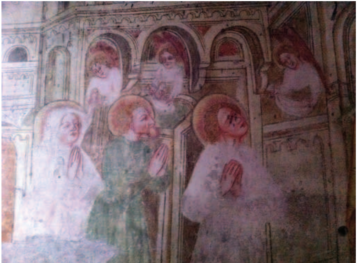
Fig. 1 Chiesa di San Nicolò a Durnholz/Valdurna (Bolzano)